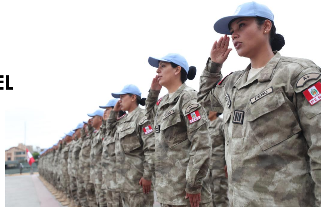
Karla CUBAS AHUMADA Capitán Ejército del Perú